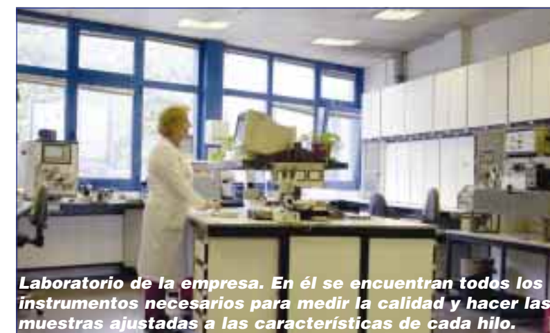
Laboratorio de la empresa. En él se encuentran todos los instrumentos necesarios para medir la calidad y hacer las muestras ajustadas a las características de cada hilo.