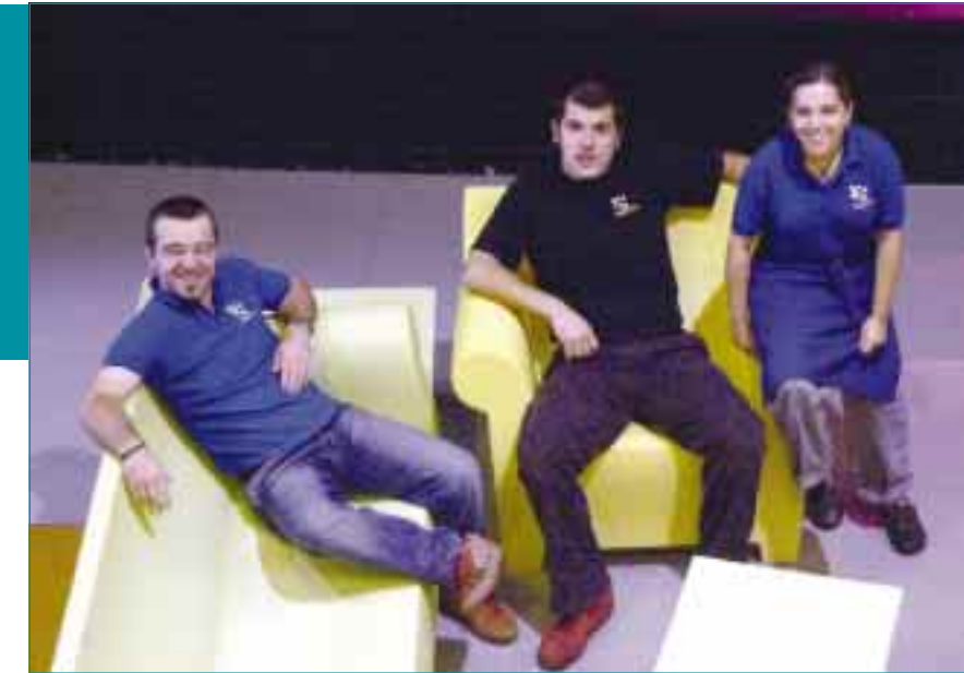
Elgetako Espaloia Kafe Antzokiak uztailean zabaltzeko berri ditu bere atea. (fño: 943 78 90 85).

Espaloia Kafe Antzokia Gipuzkoako Elgeta herrian kokatuta dago eta bere atea zabaltzeko berri ditu, 2004ko uztailean, hain zuzen ere. Bertan kulturak eta euskararen normalizazioak bat egiten dute teknologi berriekin, besteak beste. Izan ere, aretoak Interneterako doako konexioa eskaintzen du, baina baita eguneko menua eta mota guztietako ekitaldi kulturalak ere.